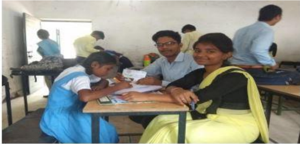
<Description of the Image with Date>

बी.एड विशेषशिक्षाअधिगम अक्षमता एवं बी.एड विशेष शिक्षा श्रवण बाधिता के प्रशिक्षु शिक्षक विभिन्न विद्यालयों में जाकरअपनेसम्बन्धित शिक्षण विषयों मेंअभ्यास करतेहैं । बी.एड विशेष शिक्षा में जाकर अध्यापकों के द्वारा किये जाने वाले सम्बन्धित शिक्षण एवं प्रशिक्षु शिक्षको के अध्यापन का अवलोकन करते हैं और शिक्षण के बारीकियों को समझतेहैं है। बी.एड विशेष शिक्षा अधिगम अक्षमता एवं बी.एड विशेष शिक्षा श्रवण बाधिता के प्रशिक्षु शिक्षक विभिन्न विद्यालयों में जाकर अपनी अपनी विशेषज्ञता के आधार पर विशेष आवश्यकता वाले छात्रों की पहचान करके उनका अध्यापन करके कौशल का विकास करते हैं साथ ही साथ विशेष आवश्यकता वाले छात्रों के अध्यापन के लिए आ.ई.पी.व केस स्टडी तैयार करते हैं ।